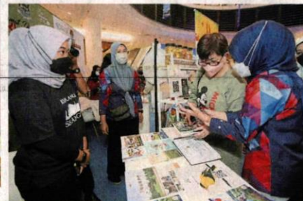
雪州地方政府单位也有参展，协助推广雪州旅游。