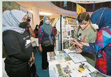
雪州地方政府单位也有参展旅游展,协助推广雪州旅游。